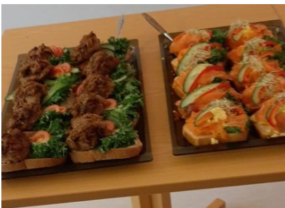
Litt av alt det gode på matbordet.

Så var det tid for «matykt», med flotte smørbrød og kaker, og vi kosa oss til langt over normal tid.