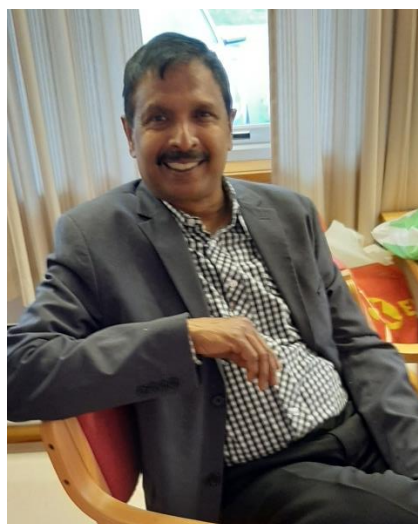
Den nye presidenten slappar godt av. For siste gong før skiftet ☺