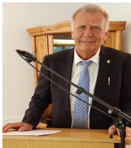
Past president hadde mange ord på hjartet