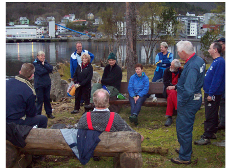
Dugnad på Brattholmen før kronprinsbesøket

Den årlige dugnaden hadde godt framsmøte av medlemmer og brattvågere som er interessert i at det skal se bra ut i Bygdeparken. Felling av stygge trær og busker