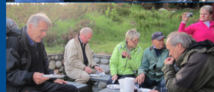
Bilder frå fisketuren