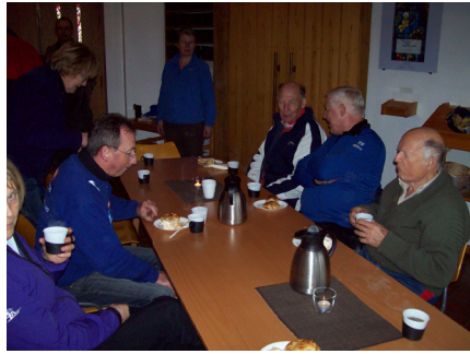
Dugnadsgjengen har fått kaffe i kirka