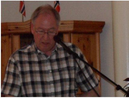
Lidvar foredrar om RIs prosjekt og oppgaver

realisert. Til å begynne med gikk utviklingen smått. Først i 1930 kunne det første bidraget deles ut. Da ble det gitt 500 dollars til en internasjonal organisasjon for funksjonshemmede barn. Rotaryfondet har senere vokst med årene til å bli et kraftig virkemiddel i Rotarys arbeid.