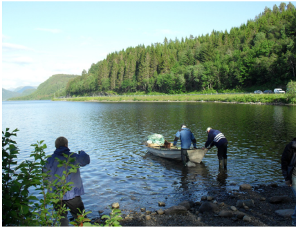
Her settes landnota