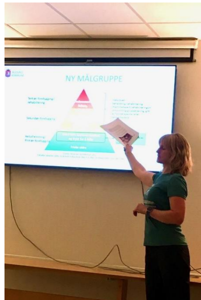
Tonje Haugen Ødegård