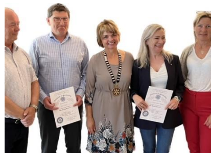
Nye medlemmer med faddere