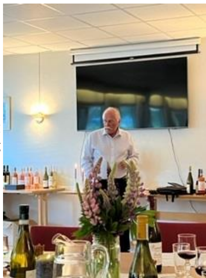
Loddsalg med premier av vanlig sort, både flytende og faste.