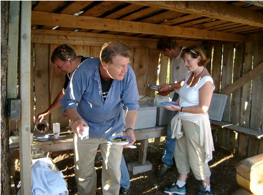
Sjølbetjening i gapahuken