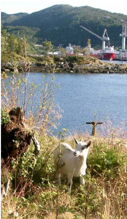
Geitene har invadert Brattholmen