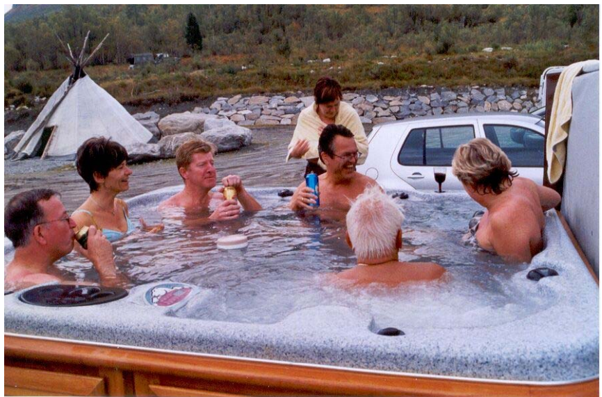
Stampen var populær etter ein lang fjelltur