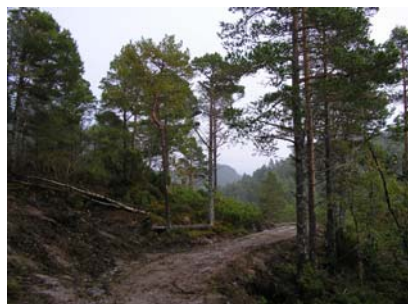
Parti frå Skarsvegen

Kveldens møte var lagt til Otterøya der vi var invitert av Midsund RK. Dei hadde nemleg høgtidleg opning av 100-årsprosjektet sitt, Skarsvegen, sist søndag. No ønskte dei å vise oss kva dei har fått til. 12 kvinner og menn var med over på ferga og fekk etterkvart både sjå og prøve denne gamle vegen som går frå Sør-Heggdal i sør over til Rakvåg på nordsida. Vegen vart opprinneleg bygd på slutten av 1860-talet og var lenge ein mykje brukt kjerreveg. Etter krigen var imidlertid forfallet kome så langt at den berre vart brukt til gangsti og i det siste var den knapt synleg. I år 2000 kom initiativrike sjeler i Midsund RK på tanken om å rehabilitere vegen både