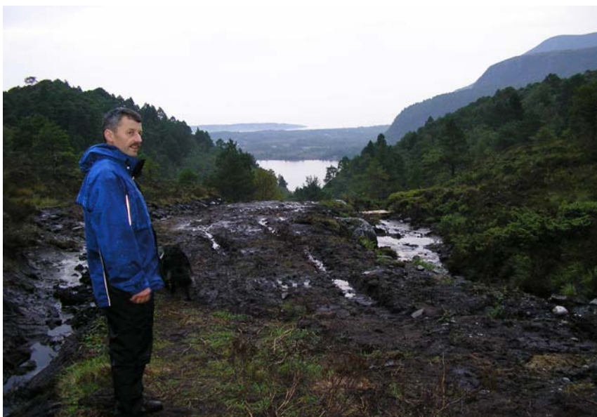
Frå toppen av Skarsvegen med utsikt nordover mot Rakvåg. Ein av Midsundkarane viser stolt fram 100-årsprosjektet til klubben