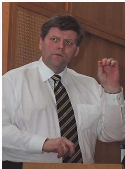
Næringsminister Ansgar Gabrielsen gjekk på barrikadane for den maritime industrien.