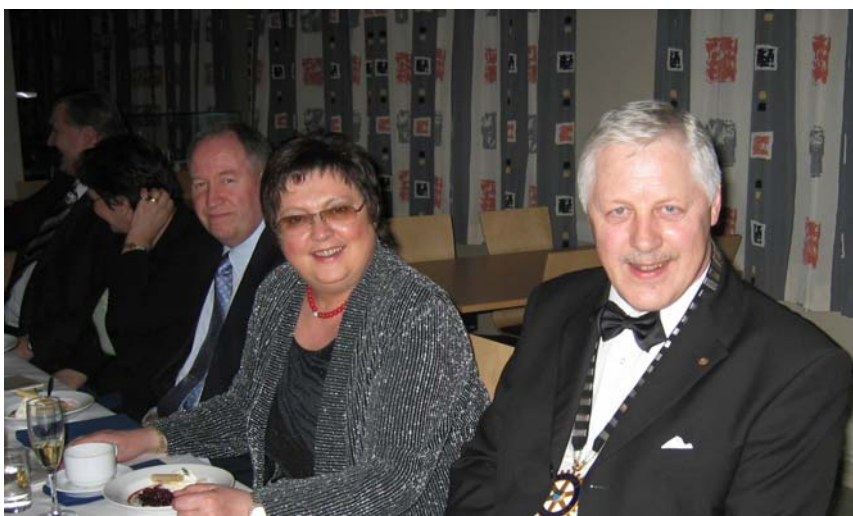
Bilete frå den flotte middagen på årsfesten med ein smilande og fornøgd pre- sident i forgrunnen!

Rotary skal utelate to ting: Parti- politikk og religion. Han ville komme med personlige betrakt- ninger knyttet opp mot Rotary. Det er 1,2 mill. rotarianere i 30 000 klubber i 66 land og i til- legg Roaract og interact. Alle klubber har møte en gang i uken, rotarianerne skal ha det hyggelig og man tar opp prosjekter. Rotary er helt frivillig og den mest demo- kratiske organisasjon, trass i ulike levevilkår, takhøyde og mulighe- ter. Rotary må avstå fra spesielle