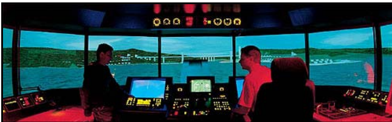
Illustrasjon frå skipssimulatoren ved Høyskolen i Ålesund

Bygget sto ferdig i 1999 og er en sammenslåing av 3 tidligere høyskoler; Sykepleie, Ingeniør og Maritim Høyskole. Bygget er på 20.000 kvm. fordelt på konf.rom, auditorier, kantine, bibliotek, laboratorier, bokhandel, lesesal - osv.