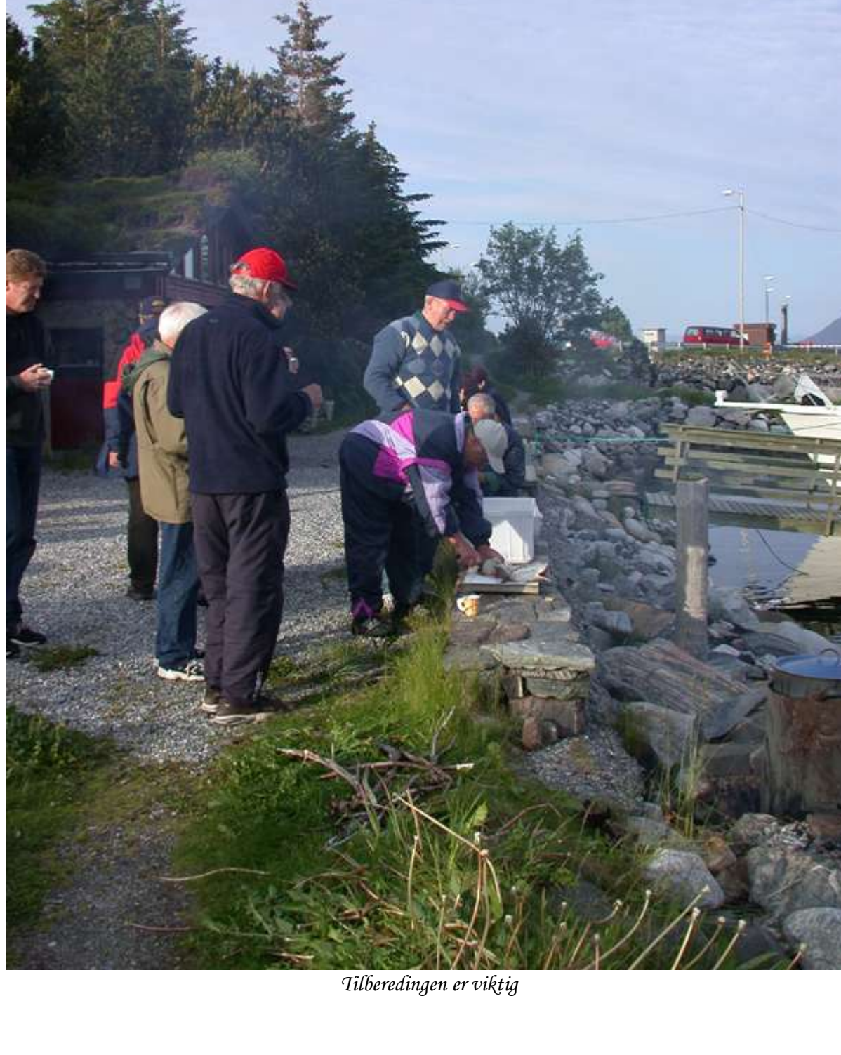
Tilberedingen er viktig