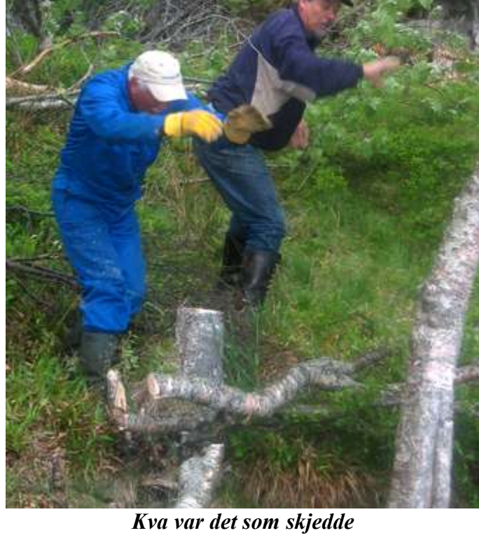
Kva var det som skjedd

Høyr kva A. O Vinje skriv: "Geiti er eit næringsdrivande dyr. Ho er alt som til er, og vel so det. Ho åt ein gong upp for meg tobakksrullen i fjellet, og der var ingen å få att på sine fem mil. Der stod eg tobakkslaus for geitekjeften! Det er mest umogeleg å svelta geiti ut