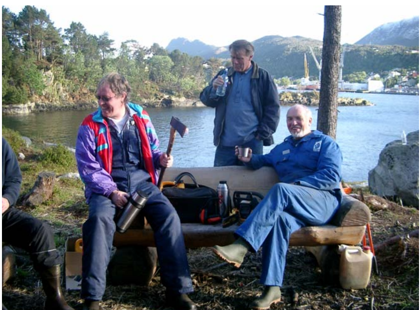
Kaffi-ykt høyrer med

22 dugnadsglade deltakarar gjorde ein stor ryddejobb på Brattholmen. Geitene har formert seg. Tre killigar spratt rundt og minst ein til er ventande.