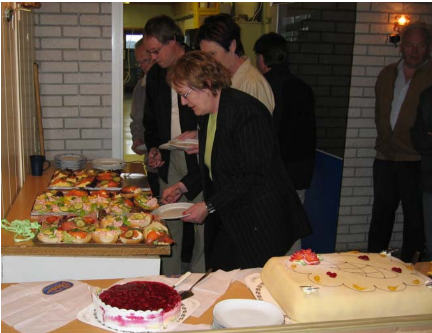
Valakerkakene gjorde ikkje skam på sitt ry.