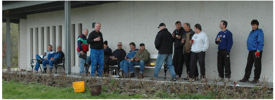
Nokre av ryddegjengen i ein velfortent pause utafør kirka

Mellom diktene fortalte han også muntre historier fra både Merrastranda og Makkavågen noen år