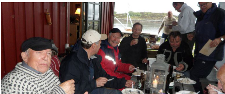
Her nytes dagens fangst