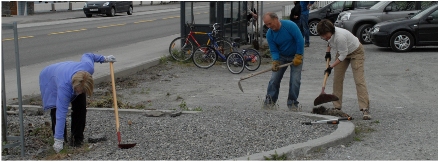
Rydding i Storgata